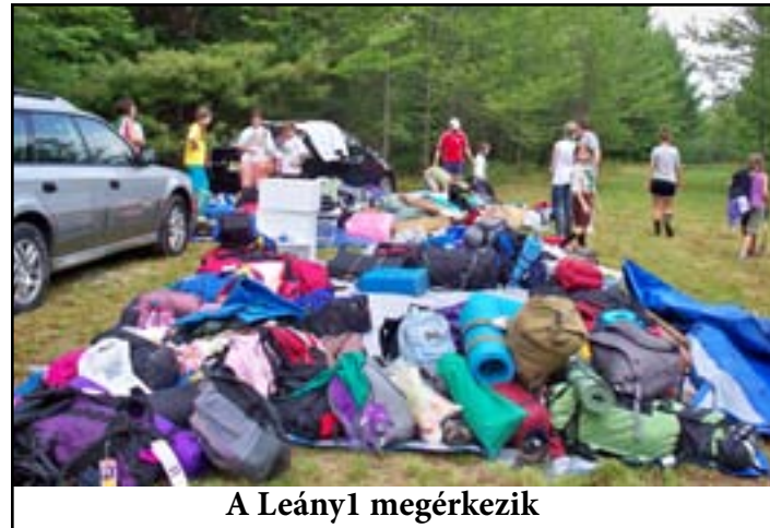
A Leány1 megérkezik